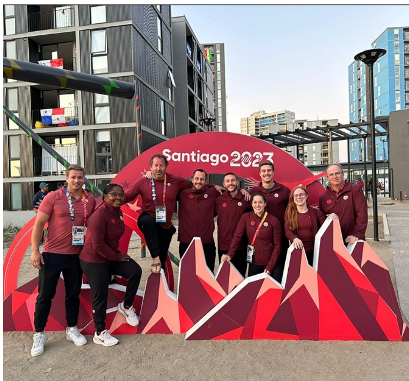
2023 Équipe des Jeux panaméricains